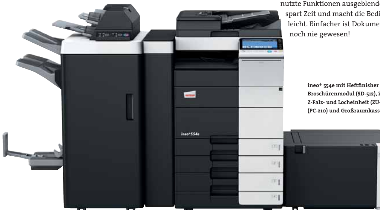
ineo+ 554e mit Heftfinisher (FS-535), Broschürenmodul (SD-512), Zuschießeinheit (PI-505), Z-Falz- und Locheinheit (ZU-606), Papierkassette (PC-210) und Großraumkassette (LU-204)

Viele Multifunktionssysteme sind alles andere als anwenderfreundlich. Doch damit ist nun Schluss – die ineo+ 554e ist für Ihre Anforderungen wie geschaffen. Das Bedienungskonzept ist intuitiv erfassbar und genauso leicht verständlich wie das eines Smartphones oder Tablet-PCs. Der kapazitive 9 Zoll-Touchscreen verfügt über vertraute Funktionen wie flick, drag&drop und pinch in&out, sodass die Bedienbarkeit ganz einfach ist. Und dank der neuen Menüstruktur lassen sich alle Funktionen auf einen Blick erfassen und die gewünschten Einstellungen mit nur wenigen Berührungen vornehmen. Ein weiterer Vorteil: Regelmäßig genutzte Funktionen können auf dem Startbildschirm abgelegt, ungenutzte Funktionen ausgeblendet werden. Das spart Zeit und macht die Bedienung kinderleicht. Einfacher ist Dokumentenproduktion noch nie gewesen!